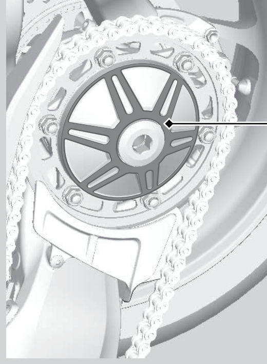
スプロケットハブ切削加工部