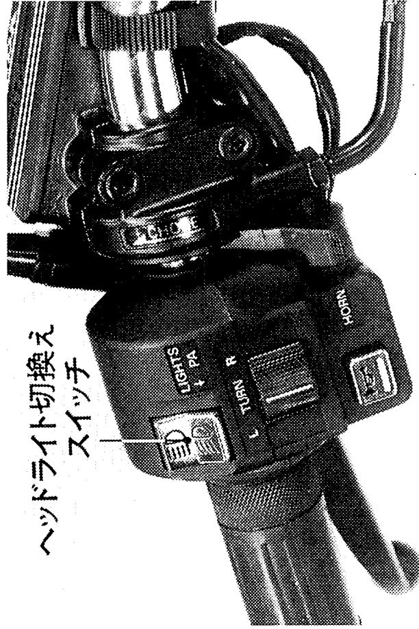
ヘッドライト切換えスイッチ