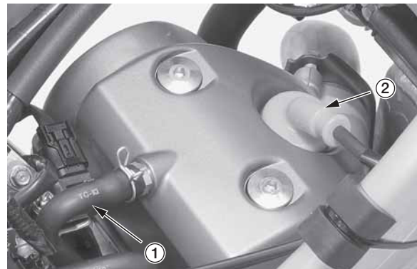
(1) вентиляционный патрубок (2) колпачок свечи зажигания