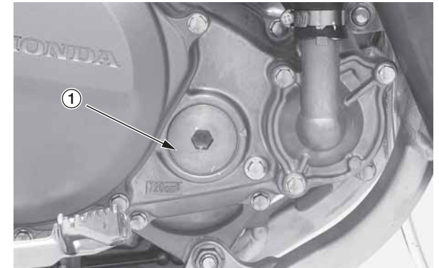
(1) крышка контрольного отверстия коленчатого вала