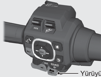
Yürüyüş Hızı modu düğmesi