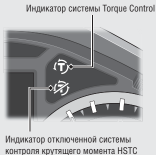
Индикатор системы Torque Control